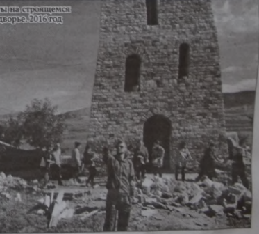
Первые туристы на строящемся Мутином подворье 2016 год