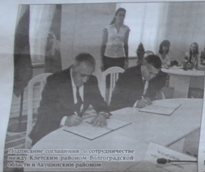
Подписание соглашения о сотрудничестве между Клетским районом Волгоградской области и Акушинским районом