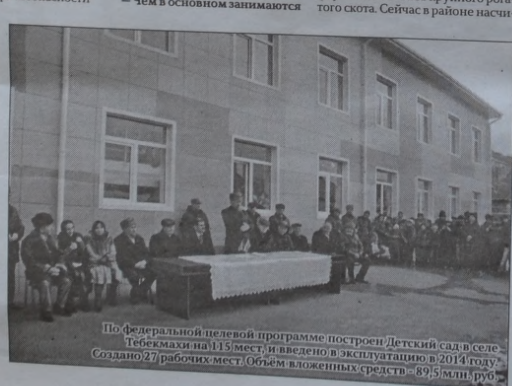
По федеральной целевой программе построен Детский сад в селе Тебехмахи на 113 мест, введено в эксплуатацию в 2014 году. Создано 27 рабочих мест. Объем вложенных средств — 89,5 млн руб.