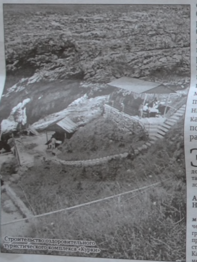
Строительство оздоровительного туристического комплекса «Курлы»